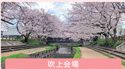
吹上会場 (鎌塚イベント広場・元荒川親水護岸周辺) 日時: 令和7年3月29日(土)・30日(日)

約500本の桜が元荒川親水護岸の両側に咲き誇り、桜の花が水面に映り、人気の撮影スポットとなっています。日中は模擬店の出店やステージイベントも開催を予定しております。