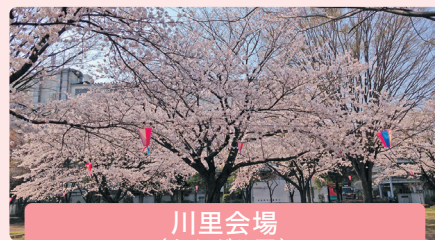
川里会場 (あかぎ公園) 日時: 令和7年3月30日(日)

約200本の桜が鴻巣公園を囲み、商店直売市やキッチンカー出店、また各種団体によるパフォーマンスが披露されご家族でお楽しみいただけます。