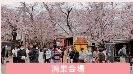
鴻巣会場 (鴻巣公園) 日時: 令和7年3月30日(日)

約500本の桜が元荒川親水護岸の両側に咲き誇り、桜の花が水面に映り、人気の撮影スポットとなっています。日中は模擬店の出店やステージイベントも開催を予定しております。